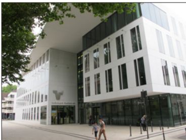
Volksbank Krefeld mit Fassade aus Nanodur-Beton